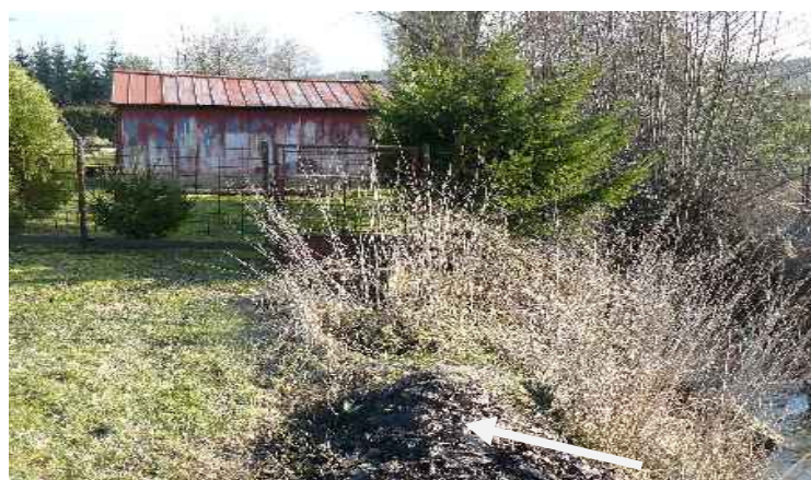
odložený sud s asfaltem na břehu potoka, nechceme zveřejňovat jméno, pokud bude odstraněn.