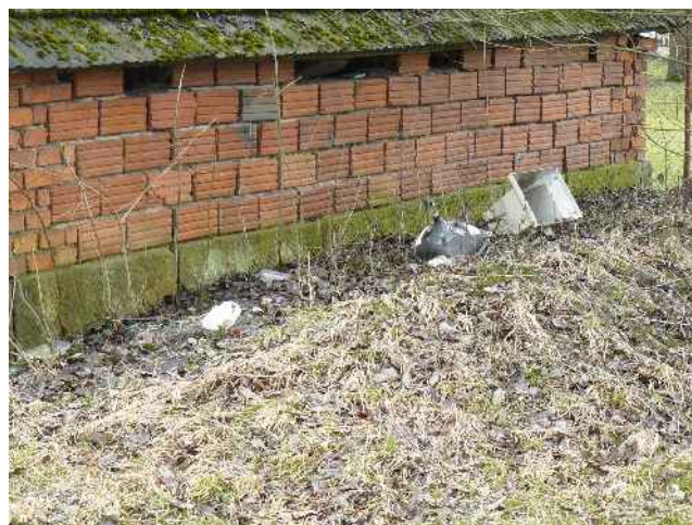
černá skládka – Lukavecký potok, za křižkem (naproti bývalé škole)